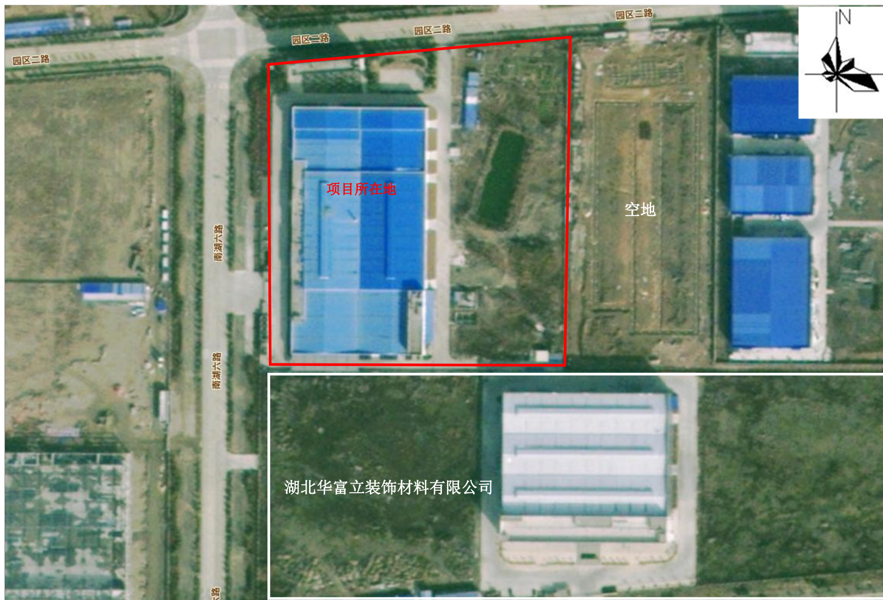
附图 2 项目周边关系示意图