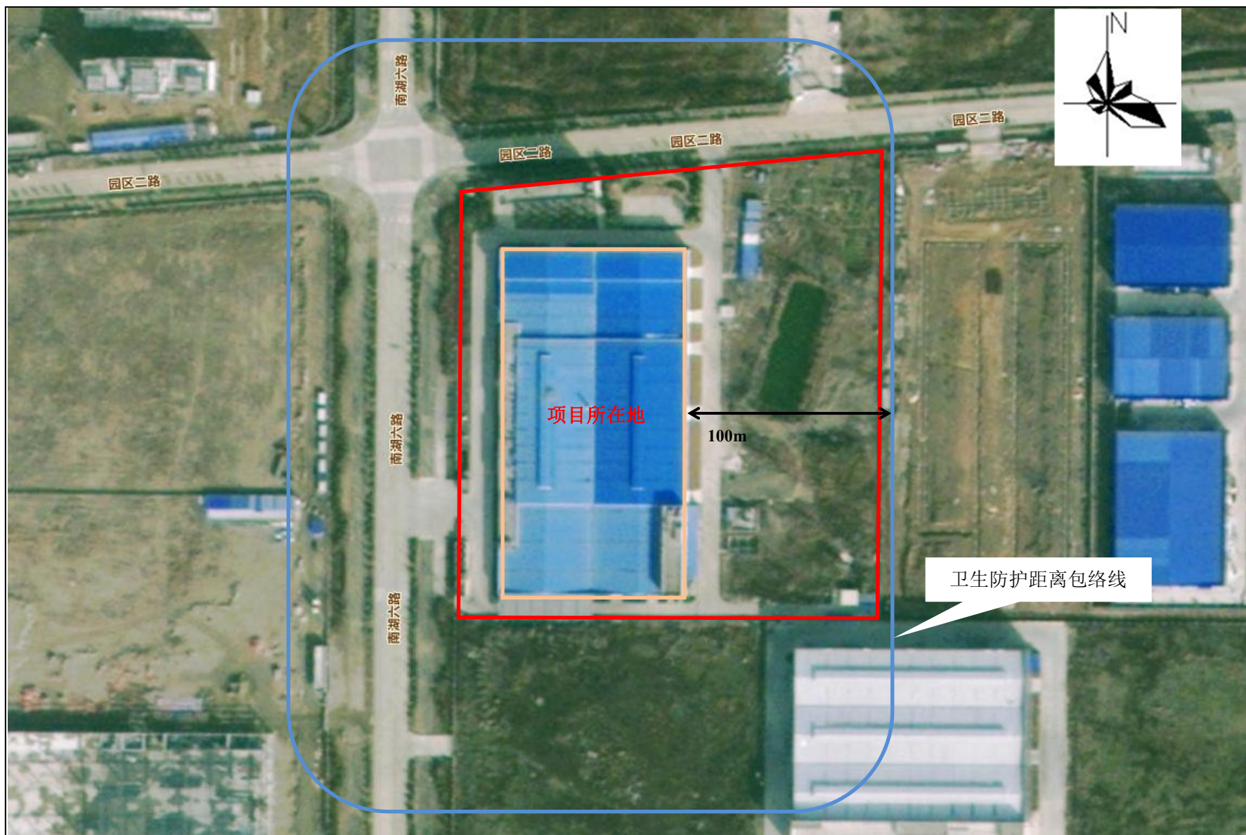
附图 5 项目卫生防护距离包络线图