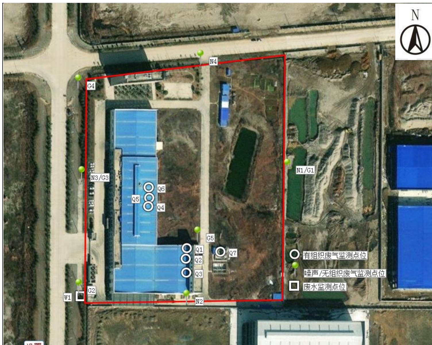
附图 4 项目监测点位图